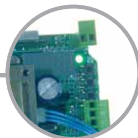
Todos los cuadros de maniobra de la serie RR pueden ser fácilmente programados mediante un display y tres botones.