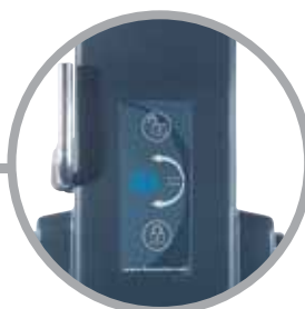
Simple desbloqueo manual