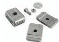
PLA13 Fines de carrera mecánicos para apertura y cierre. Uds./paquete 4