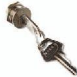
CM-B Trinquete con dos llaves metálicas de desbloqueo. (precio: v. lista de los recambios)