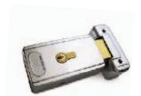
PLA11 Electrocerradura 12 V horizontal (obligatoria para hojas superiores a 3 m). Uds./paquete 1