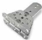
PLA14 Estribo trasero regulable a enroscar. Uds./paquete 2