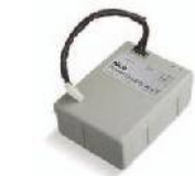
PS124 Batería 24 V con cargador de baterías integrado. Uds./paquete 1