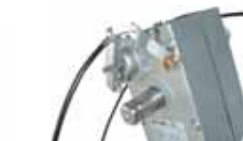
Desbloqueo externo. Conjunto de herrajes que permiten el desbloquear el operador desde el exterior (necesita maneta).